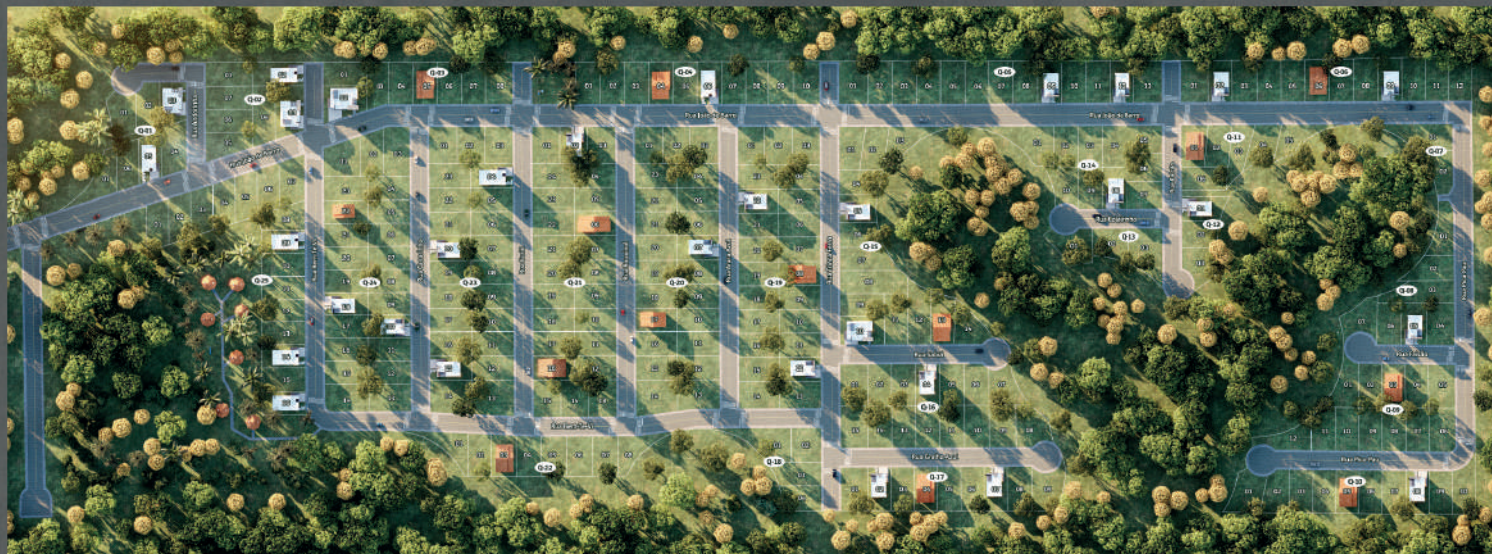
TABELA DE LOTES